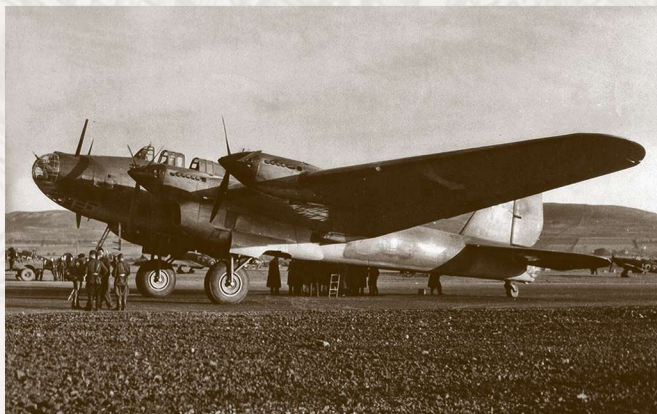
КБ Петлякова. Пе-8. Тяжелый дальний бомбардировщик

Владимир Михайлович Петляков – выдающийся конструктор тяжёлых самолётов серии «АНТ-». На самолёте АНТ-20 («Максим Горький») – крупнейшем для своего времени, совершил полёт Антуан де Сент-Экзюпери. В 1937 году на самолёте АНТ-25 были установлены два рекорда дальности при перелёте через Северный полюс в США. Первый – 10148 км по прямой, совершили лётчики В. Чкалов, Г. Байдуков и А. Беляков; второй – по ломаной 11500 км, – лётчики М. Громов, А. Юмашев и С. Данилин.