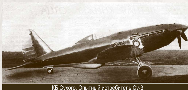
КБ Сухого. Опытный истребитель Су-3

Павел Осипович Сухой – конструктор-новатор, один из основателей реактивной и сверхзвуковой авиации. Под его руководством разработано более пятидесяти конструкций самолётов, в том числе знаменитые истребители, бомбардировщики и штурмовики серии «Су-», получившие обозначение по его фамилии – Главного авиационного конструктора Опытного конструкторского бюро.