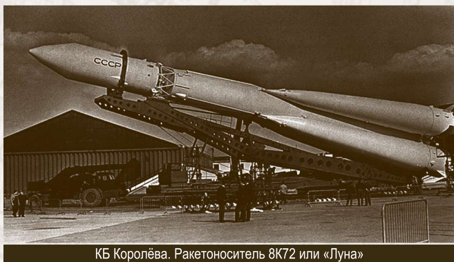
КБ Королёва. Ракетноноситель 8K72 или «Луна»

В числе самых выдающихся – Сергей Павлович Королёв, учёный, академик, главный конструктор первого спутника Земли и первого космического корабля с человеком на борту. Туполев руководил дипломной работой этого славного выпускника МВТУ – будущего основоположника практической космонавтики. Он сделал Россию передовой ракетно-космической державой.