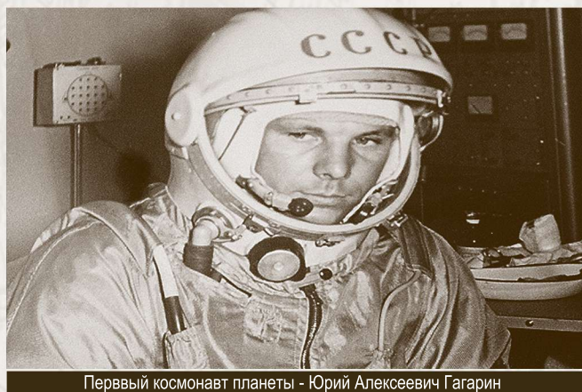
Первый космонавт планеты - Юрий Алексеевич Гагарин

Через сорок лет в городе Жуковском, названном в честь русского Галилея, будущие космонавты готовились к первому полёту за пределы Земли. Так замкнулась великая связь поколений пионеров воздухоплавания и освоения космоса.