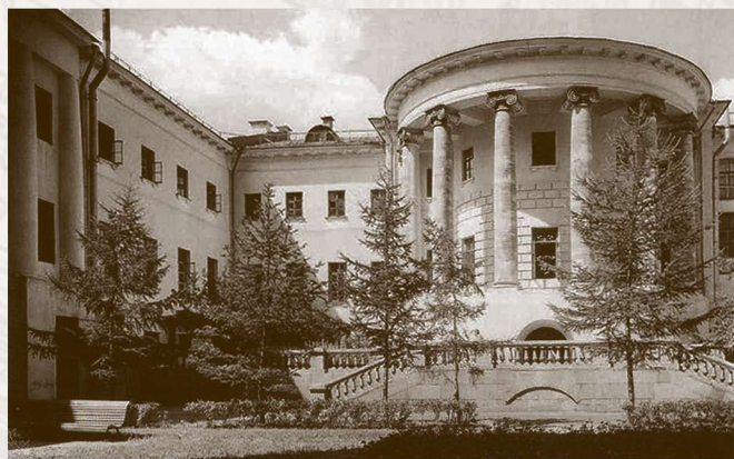
МВТУ им. Баумана, Слободской дворец. Центральная часть, парковый фасад

Именем российского Галилея названы кратер на обратной стороне Луны, академии и институты, наукоград, в котором ежегодно проходит Международный авиационно-космический салон (МАКС), кафедра теоретической механики, которую он основал почти 150 лет назад в Императорском московском техническом училище (ИМТУ), а ныне это Московский государственный технический университет имени Н.Э. Баумана. Бауманский университет – Московский ракетный колледж на Яузе, как его называют на Западе, стал колыбелью современного инженерного образования и мирового воздухоплавания. Из стен Бауманского университета человечество шагнуло в космос.