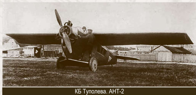
КБ Туполева. АНТ-2

Андрей Николаевич Туполев – это целая эпоха в авиации. Под руководством Туполева спроектировано более ста типов самолётов, они и сегодня летают по всему миру. Он был сподвижником Жуковского при создании Центрального аэрогидродинамического института (ЦАГИ), ставшего лидером мирового стратегического самолетостроения.