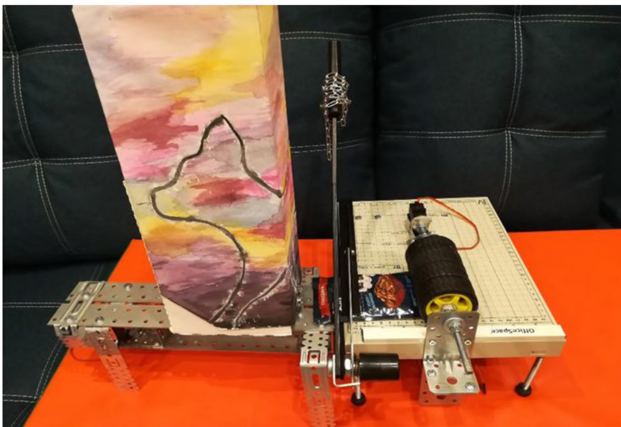
Рис. 2. Прототип автоматизированной кошачьей кормушки «Пух»

Устройство состоит из пяти основных модулей: модуля управления; подачи; распаковки; выдачи и пользовательского интерфейса.