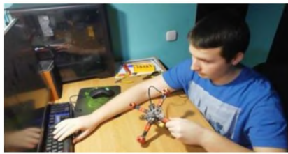
Рис. 2. Проверка работы квадрокоптера