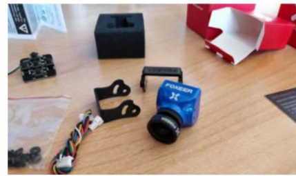
Рис. 3. Бортовая камера квадрокоптера