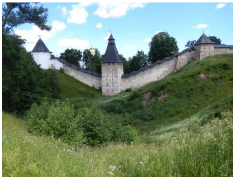
Фото 2. Свято-Успенский Псково-Печерский монастырь