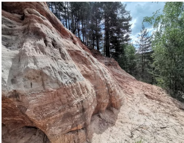
Фото 1. Геологическое обнажение девонских пород (Демьяненко Е., 2021 г.)

Результаты исследования. Первичный отбор природных и историко-культурных объектов и ландшафтов показал наличие разнообразных объектов в пределах г. Печоры: башня водонапорная с электростанцией (Октябрьская пл., 7); святой источник Иоанна Предтече (ул. Ивановская, д. 8); плотина на реке Пачковка (ул. Малая Пачковка); геологическое обнажение девонских пород (ул. Малая Пачковка; фото 1); родник «Фёдоров ключок» (ул. Малая Пачковка); Свято-Успенский Псково-Печерский монастырь в оборонительной форме рельефа.