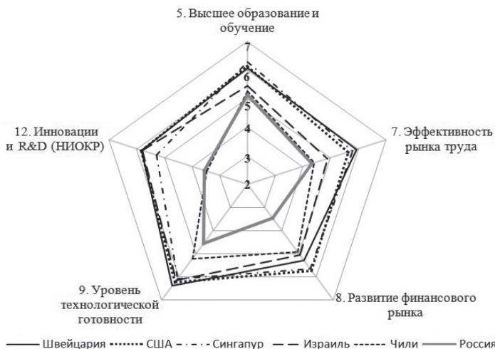
Рис. 1. Диаграммы показателей ключевых субиндексов GCI 2017–2018, вошедших в UDI/c, для стран первых четырех лидирующих регионов, США и России